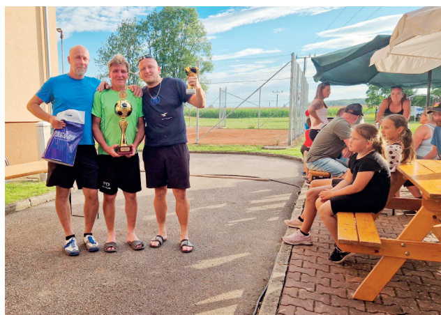
Sokolové z Černčic

Počasi nám přálo a turnaj se vydařil, všichni už se těšíme na další ročník.