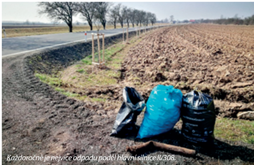
Každoročně je nejvíce odpadu podél hlavní silnice II/308.