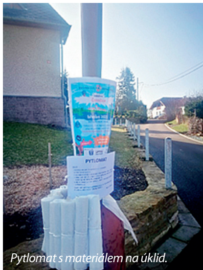
Pytlomat s materiálem na úklid.