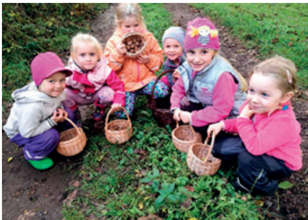
Veverky na oříškách.