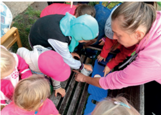
Vlčata zkoumají vodní rostlinu při fotosyntéze.