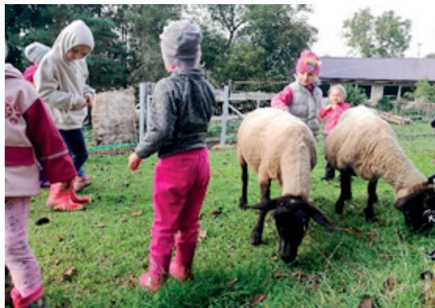
Ve výběhu s ovečkami.