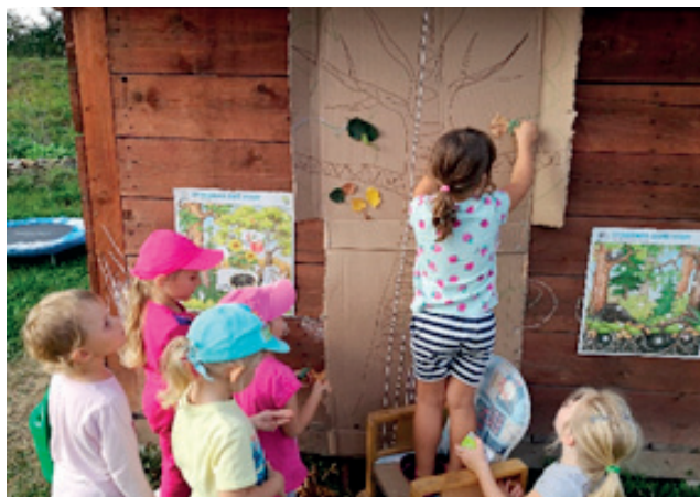
Povídání o stromech.